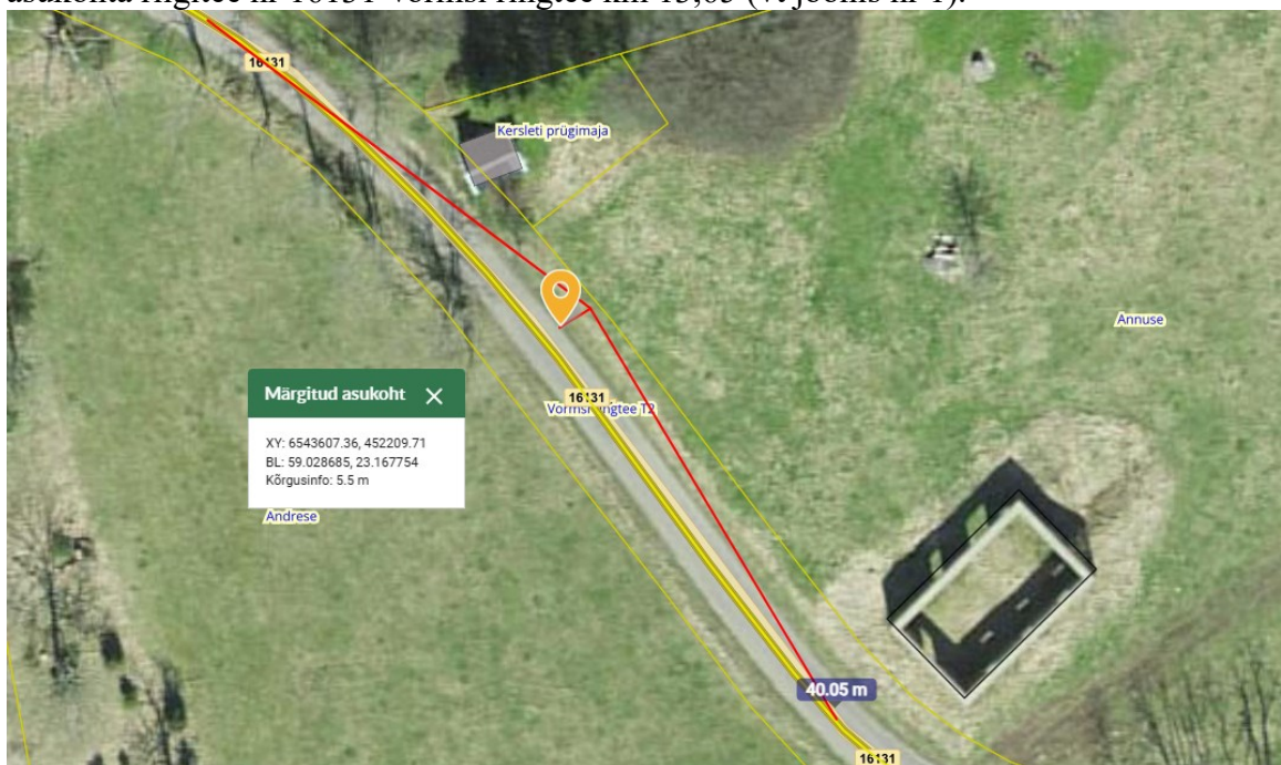
Joonis nr 1. Ristumiskoha asukoht tähistatud oranži tingmärgiga.